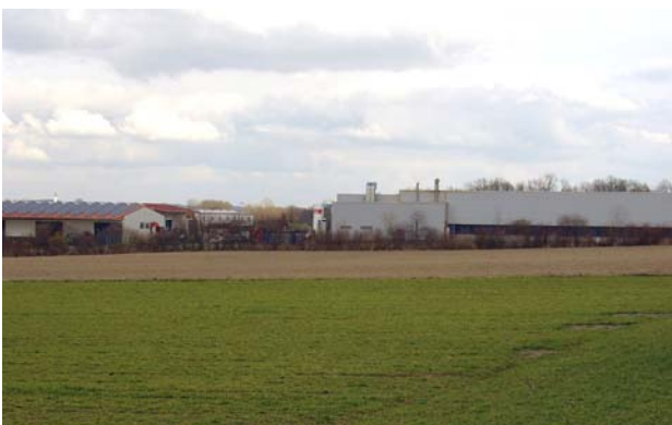
Foto des Gewerbegebietes

Die Gemeinde hat keine speziellen Prioritäten für Neuansiedlungen in diesem Gewerbegebiet, Unternehmer aller Branchen sind willkommen.