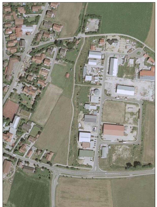
Luftbild des Gewerbegebiets

Die Gemeinde hat keine speziellen Prioritäten für Neuansiedlungen in diesem Gewerbegebiet, Unternehmer aller Branchen sind willkommen.