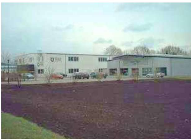
Foto des Gewerbegebiets

Die Gemeinde hat keine speziellen Prioritäten für Neuansiedlungen in diesem Gewerbegebiet, Unternehmer aller Branchen sind willkommen.