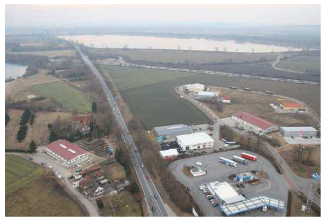
Luftbild des Gewerbegebiets