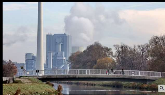
Das Kraftwerk in Angiberg wird zum "Energiepark" ausgebaut.

16. Juni 2023, 13:28 Uhr | Lesezeit: 2 Min.