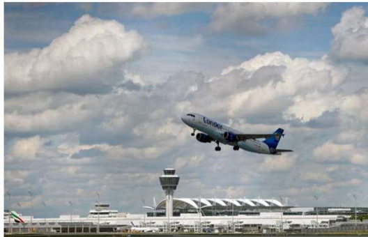
Startbahn-Baurecht: Die Kläger haben gegen das Urteil eine Nichtzulassungsbeschwerde eingelegt.

Der Abwehrkampf gegen die 3. Start- und Landebahn geht weiter – juristisch und politisch. Die Kläger haben gegen das VGH-Urteil eine Nichtzulassungsbeschwerde eingelegt.