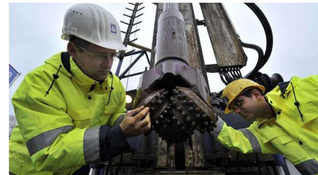
Um Bohren geht's noch lange nicht, aber nun wurde in Neufahrn und Eching eine Erlaubnis „zur Aufsuchung von Erdwärme zu gewerblichen Zwecken“ erteilt.

In Neufahrn und Eching nimmt das Thema Erdwärme immer konkretere Formen an. Jetzt ist man einen entscheidenden Schritt weiter.